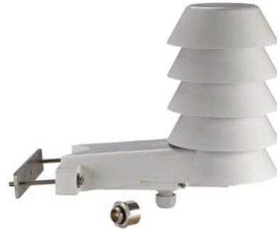
Tableau 1 : Caractéristiques et Avantages

Les disques qui constituent l'écran protègent les capteurs du rayonnement solaire et des précipitations sans affecter leurs performances. Leur profil particulier permet une bonne circulation de l'air et les matériaux qui les composent ont été sélectionnés pour garantir une haute réflectivité, une faible conduction thermique et une résistance maximale aux intempéries. Ils assurent une longue durée de vie même dans les pires conditions climatiques.