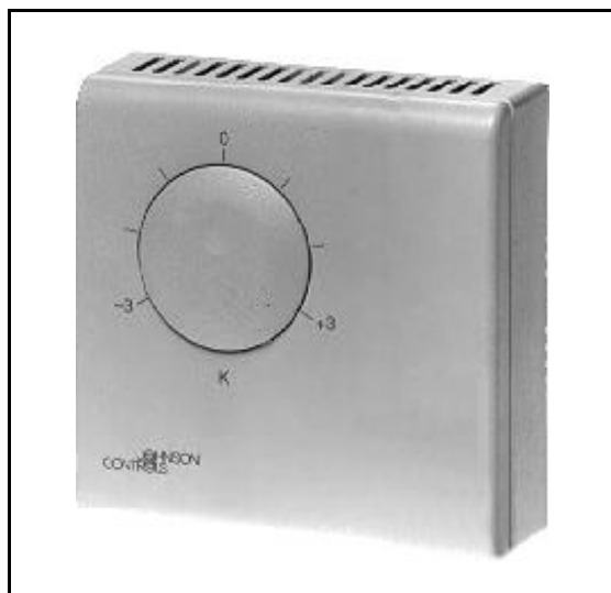
Figure 8 : Sonde de température d'ambiance