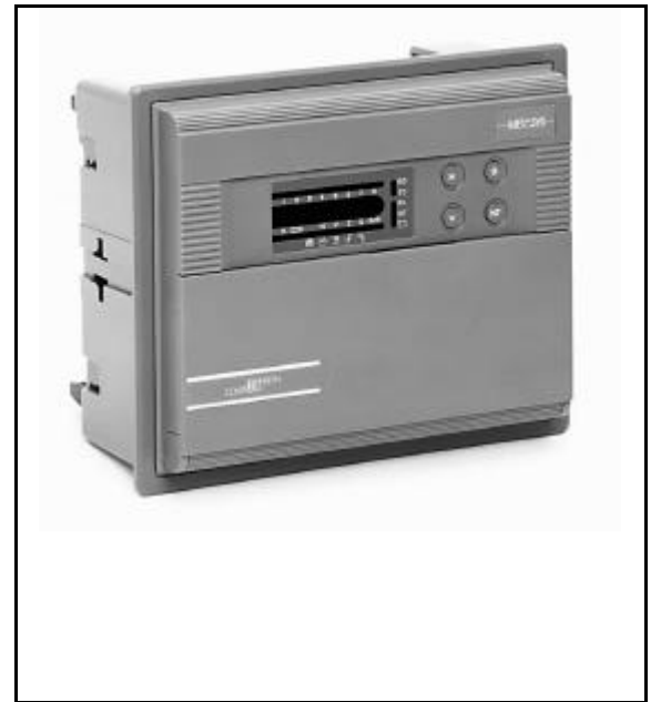
Figure 5 : DX-9200 avec châssis de montage sur porte d'armoire