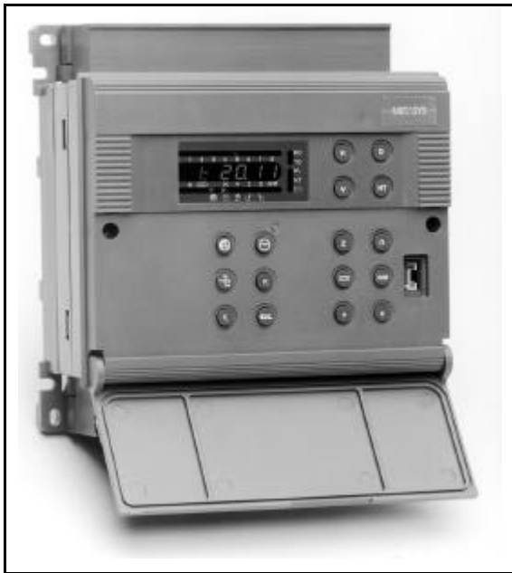
Figure 4 : DX-9200 avec châssis de montage sur panneau

Le régulateur numérique DX-9200 LonWorks®, existe en deux versions de châssis de montage. Le premier châssis est destiné à être monté sur un panneau à l'intérieur d'un tableau de commande ou directement sur l'équipement réglé au moyen d'un rail DIN. L'autre châssis est prévu pour être monté sur la porte d'une armoire. Les deux modèles permettent de monter et de connecter le châssis au câblage local avant d'installer le régulateur.