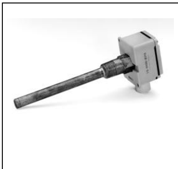
Figure 7 : Sonde de température de fluide

standard 4-20mA. Les sorties peuvent être utilisées pour commander des servomoteurs électriques proportionnels et/ou incrémentaux, aussi bien que des relais tout ou rien pour la commande de moteurs, des étages de chauffage ou de refroidissement d'autres équipements électriques, comme les relais de commande d'éclairage. Des servomoteurs pneumatiques peuvent être commandés par un transducteur externe.