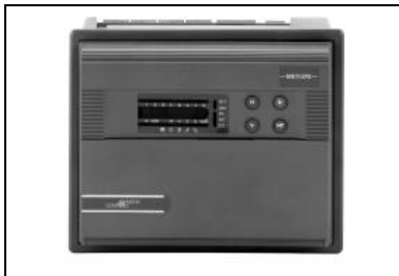
Figure 1 : DX-9200

De plus, chaque régulateur peut partager ses données avec d'autres régulateurs sur le même réseau. Quand il est incorporé à un réseau Metasys® complet, des informations relatives aux points et à la régulation sont disponibles à travers tout le réseau et à tous les postes opérateur du réseau Metasys®.