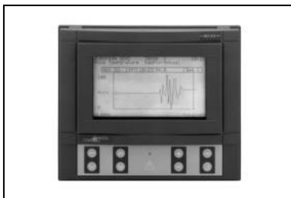
Figure 2 : DT-9100