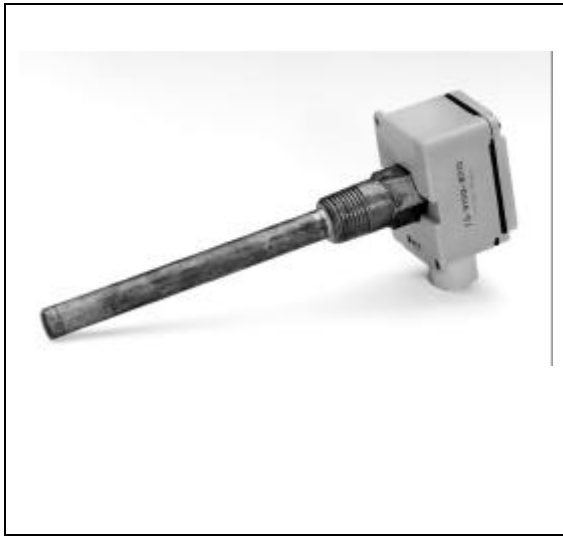
Figure 7 : Sonde de température de débit

4-20mA. Les sorties peuvent être utilisées pour commander à la fois des servomoteurs électriques proportionnels et/ou incrémentiels, des relais tout ou rien pour la commande de moteurs, des étages de chauffage ou de refroidissement d'autres équipements électriques comme les relais de commande de l'éclairage. Des servomoteurs pneumatiques peuvent être commandés par un transducteur externe.