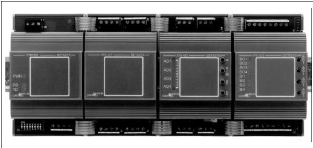
Figure 6 : Modules d'extension avec dérogation manuelle

Le module d'extension XTM et ses modules d'expansion offrent une gamme plus souple d'options d'E/S ainsi qu'une option de dérogation manuelle sur les sorties.