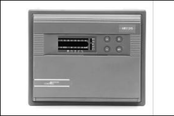
Figure 1 : DX-9100

Quand il est incorporé à un réseau Metasys complet, des informations relatives aux points et à la régulation sont disponibles à travers tout le réseau et à tous les postes opérateur du réseau Metasys.