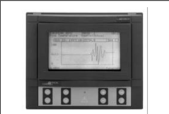
Figure 2 : DT-9100